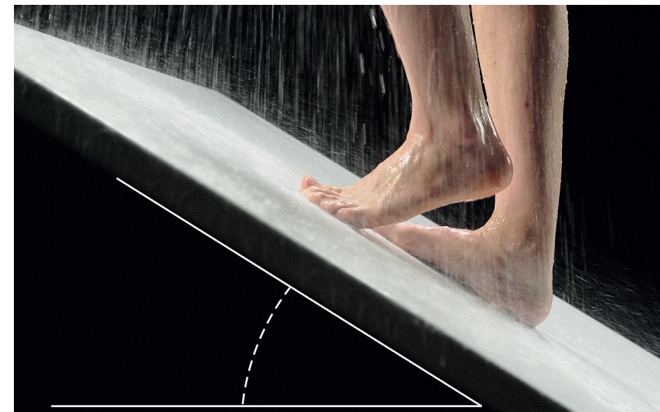
Geprüfte Standfestigkeit: Die LGA Bautechnik bestätigt Invisible Grip eine Rutschhemmung gemäß Bewertungsklasse C für nassbelastete Barfußbereiche nach DIN EN 16165.

Invisible Grip steht wie jedes Produkt der Luxsustainability®-Welt von Kaldewei für kompromisslose Sicherheit und Vertrauen verbunden mit einer hochästhetischen Oberflächenbeschaffenheit. Oder anders gesagt: In Glamour We Trust. Invisible Grip zeigt einmal mehr die besondere Innovationskompetenz von Kaldewei, für die der Premiumhersteller mit dem Siegel der Bescheinigungsstelle Forschungszulage (BSFZ) ausgezeichnet worden ist.